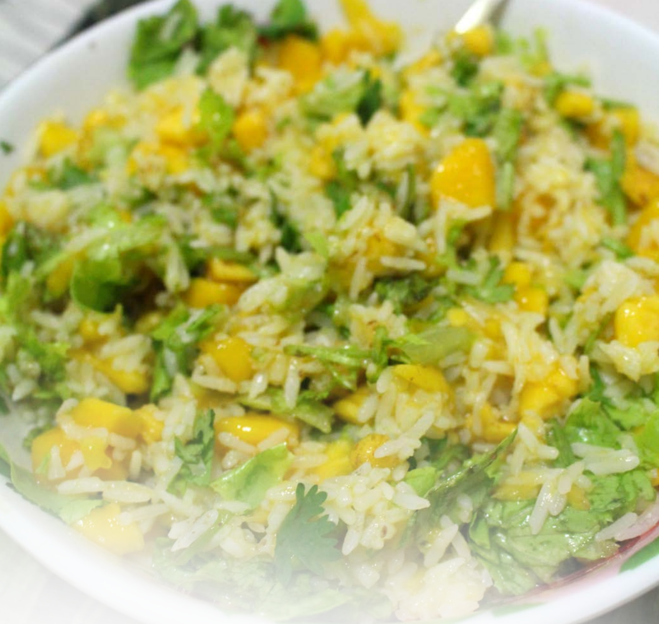
Risret med mango