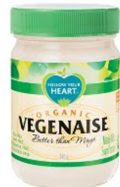
Follow Your Heart Vegenaïse Øko 340g Udsolgt