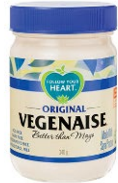
Follow Your Heart Vegenaïse Original 340g Udsolgt