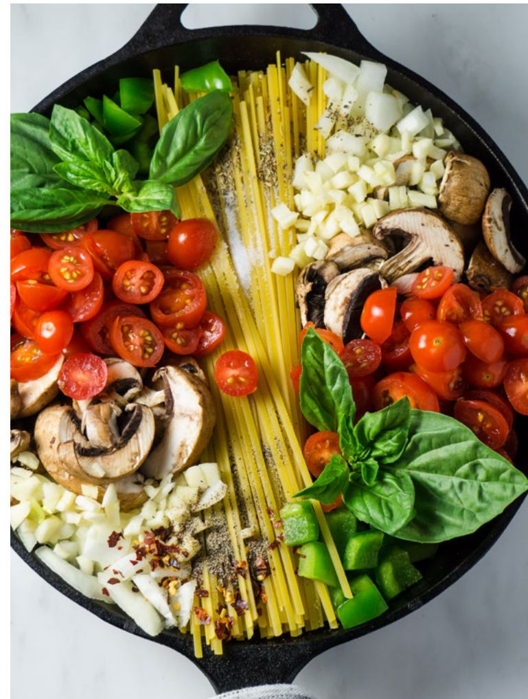
Spaghetti / pasta / noodels