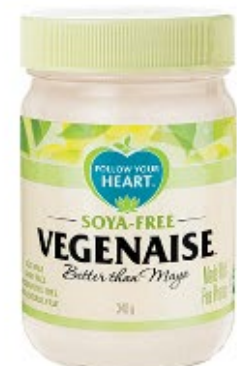
Follow Your Heart Vegenaïse Sojafri 340g.