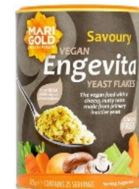
Marigold Glutenfrie Gærflager 125g 55,00 kr