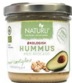
Naturli Hummus m. Avocado øko, 130 g 29,95 kr