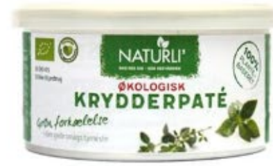
Naturli' Krydderpaté øko, 125g 26,00 kr