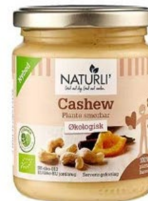
Naturli Cashew Smørbar øko 250g. 74,95 kr