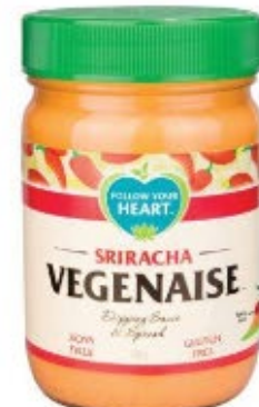
Follow Your Heart Vegenaïse Sriracha sojafri 340g