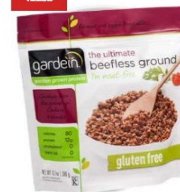
Gardein Ground Beef glutenfri 390g (BEMÆRK! Må kun bestilles til afhentning på vores lager i Nørresundby)