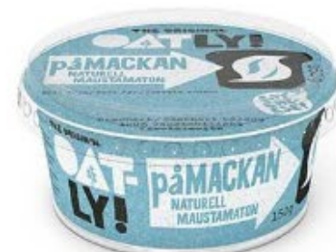
Oatly påMACKAN smørpålæg, 150g (bedst før: 26/9-18)