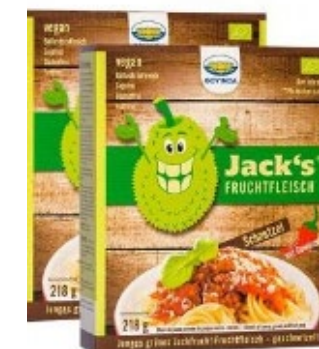
3ovinda Pulled Jackfruit, 200 g. 39,00 kr