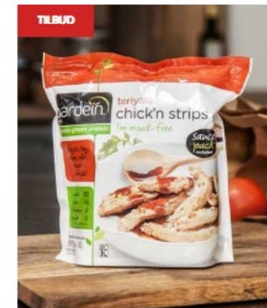
Gardein Teriyaki Strips 300g. (BEMÆRK! Må kun bestilles til afhentning på vores lager i Nørresundby)